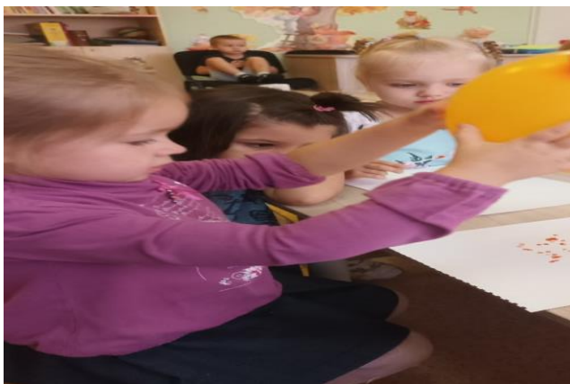
Рисование воздушными шарами